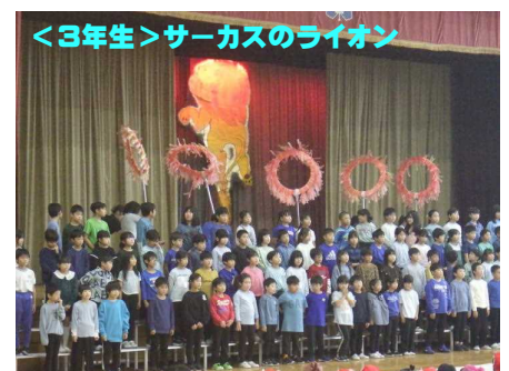
<3年生>サーカスのライオン