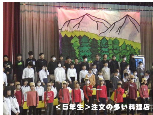
<5年生>注文の多い料理店