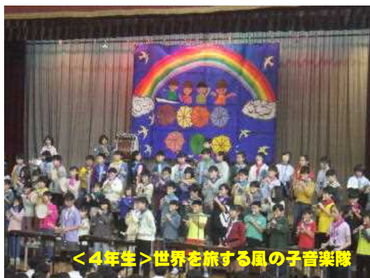
<4年生>世界を旅する風の子音楽隊