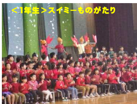
<1年生>スイミーものがたり