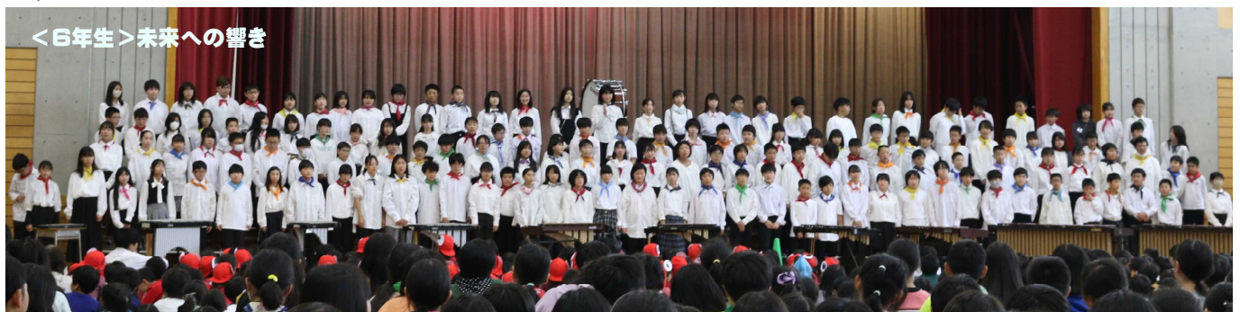
<6年生>未来への響き

「全員で力を合わせてひとつのものをつくる」というこの経験は、子供たちをさらに成長させたと感じています。ご家庭においても学習発表会での一人一人の頑張りを褒めていただき、ありがとうございました。励ましていただくことで、より一層成長していくことと思いますので、今後どうぞよろしくお願い致します。