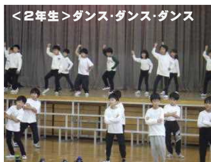
<2年生>ダンス・ダンス・ダンス