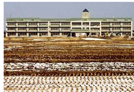
開校直前の五小校舎 (H8冬撮影)